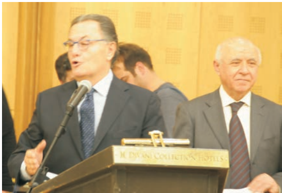
Χαιρετισμός από τον πολιτευτή Ν.Δ. Β' Αθηνών πρώην υπουργό Εθνικής Αμύνης και επίτιμο μέλος του Συνδέσμου κ. Πάνο Παναγιωτόπουλο.