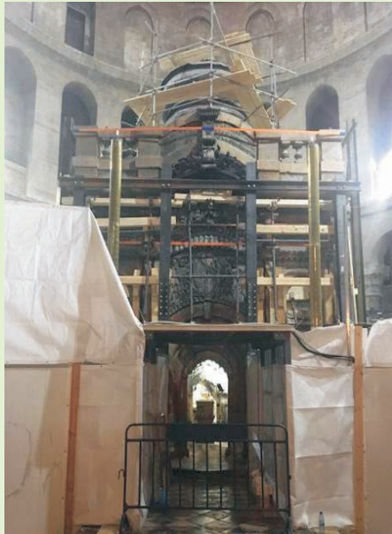
Το Ιερό Κουβούκλιο πριν την ολοκλήρωση των εργασιών.

ΔΕΚΕΜΒΡΙΟΣ 2016 - ΜΑΪΟΣ 2017 ΤΕΥΧΟΣ 75 ΕΞΑΜΗΝΙΑΙΑ ΕΚΔΟΣΗ ΤΟΥ Ε.Σ.Π.Τ ΕΛΛΗΝΙΚΟΣ ΣΥΝΔΕΣΜΟΣ ΠΑΝΑΓΙΟΥ ΤΑΦΟΥ & Ι. ΜΟΝΗΣ ΣΙΝΑ Βουλής 36, ΑΘΗΝΑ 105 57