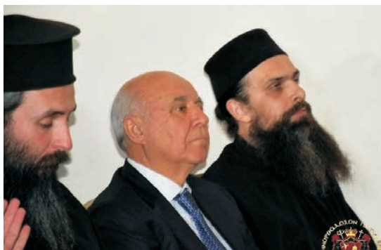
Ο Πρόεδρος και τα μέλη του Δ.Σ. στον εορτασμό της 25ης Μαρτίου στην Πατριαρχική Σχολή Ιεροσολύμων