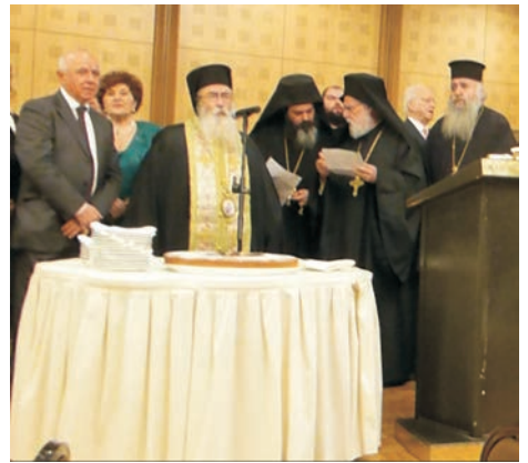
Καλωσόρισμα από τον Πρόεδρο κ. Λάζαρο Μάρκου. Ο Σεβασμιώτατος Αρχιεπίσκοπος Σινά, Φαράν και Ραϊθώ κ. Δαμιανός κόβει την πίτα.