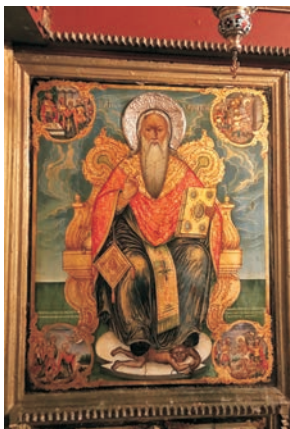
Ιερά εικόνα του Αγ. Χαράλαμπος από την ομώνυμη Ιερά Μονή.