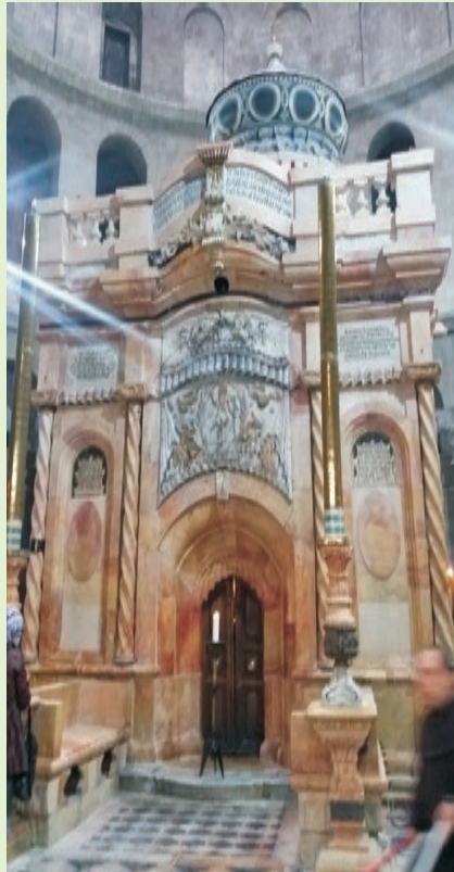
Το Ιερό Κουβούκλιο μετά την ολοκλήρωση των εργασιών.