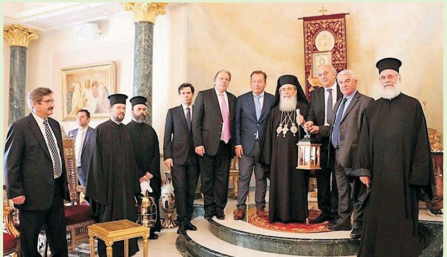
Η Α.Θ.Μ. Πατριάρχης Ιεροσολύμων Θεόφιλος Γ΄ στην Αίθουσα του Θρόνου μετά την αφή του Αγ. Φωτός, παρουσία αγιοταφίτων Πατέρων και εκπροσώπων της Ελληνικής Εκκλησίας και Πολιτείας.