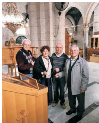
Εσωτερικό Ιερού Ναού Αγίου Γεωργίου Λύδδης.