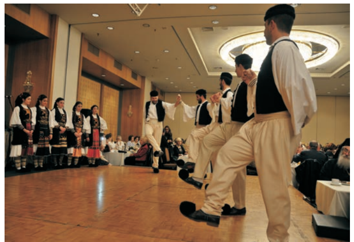
Χορευτικά δρώμενα από το Λύκειο των Ελληνίδων Παπάγου-Χολαργού.