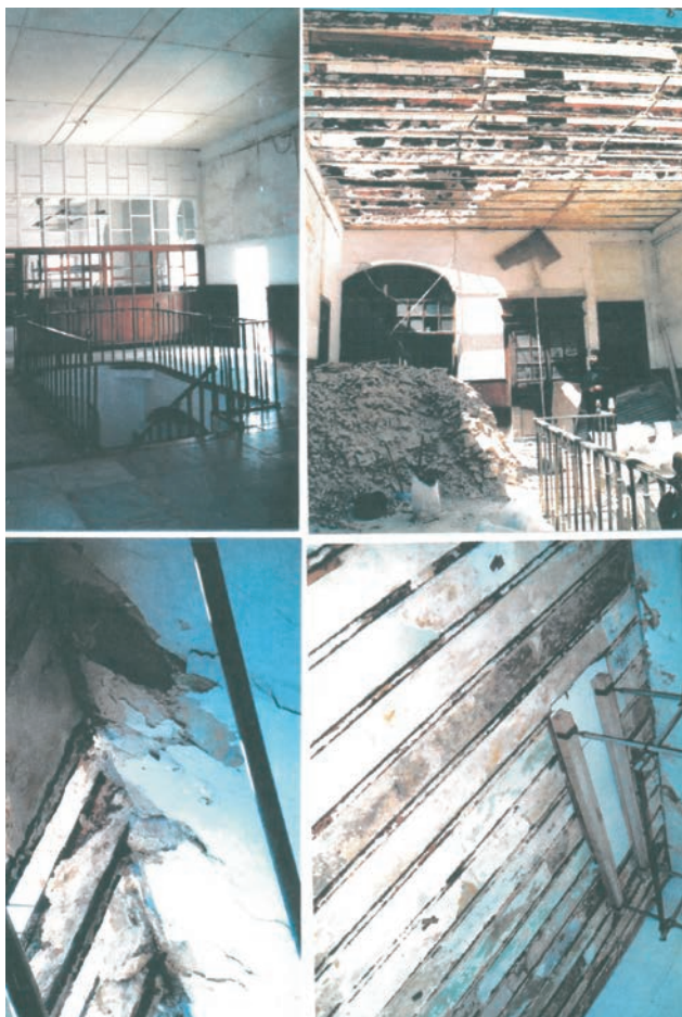
Παλαιά αίθουσα Πατριαρχείου πριν την αποπεράτωση.

Ανακαίνιση Ιεράς Μονής Αγίου Νικοδήμου (Μοναστήρι της Φακίης) συνολικού κόστους 40.000,00 ευρώ.