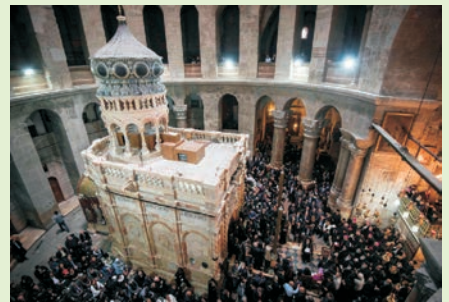
Αναμονή αφής Αγίου Φωτός μετά την αφαίρεση των μεταλλικών στηριγμάτων.