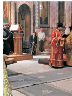
Ο Πρόεδρος και η Γεν. Γραμματέας στο Ναό της Αναστάσεως κατά τη διάρκεια της Θ. Λειτουργίας.