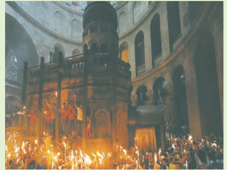
Αφή του Αγίου Φωτός πριν την ολοκλήρωση των εργασιών όπου εμφανίζονται τα μεταλλικά στηρίγματα..