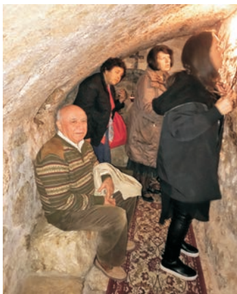
Από το ησυχαστήριο της Αγίας Μελάνης (Μεγάλη Παναγιά).