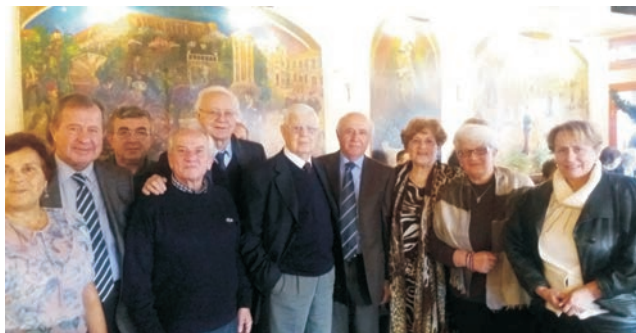
Το Δ.Σ. στον περίβολο του Ι. Ναού Αγίων Αναργύρων.

Η τέλεση μνημοσύνου υπέρ αναπαύσεως των θανόντων μελών αποτελεί για μας υψίστη υποχρέωση αλλά και εφελκτήριο για τη συνέχιση του σπουδαίου και άξιου έργου τους.